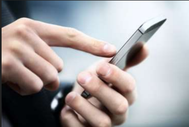
High Speed Mobile Internet