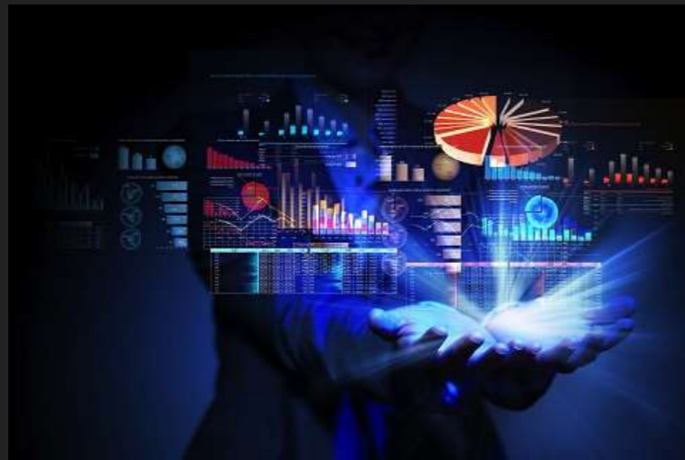
Big Data Analytics